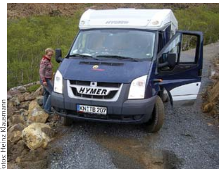
Wind, Wetter und Streckenführung stellen Fahrer und Material auf eine harte Probe.

Durch eine abgeschiedene Küstenlandschaft führt der Weg weiter Richtung Brønnøysund in Helgeland. Nach 402 Kilometern erkunden wir an unserem ersten Ruhetag den Torgatten. Um diesen 260 Meter hohen Felsen mit einem riesigen Loch in der Mitte ranken sich etliche Sagen. Das Loch stamme von einem Pfeil, den der Riese Hestmann auf einen