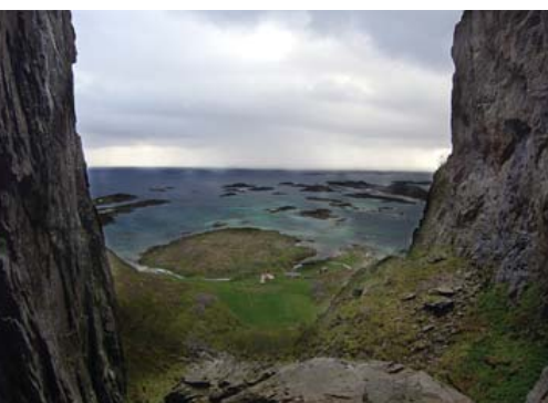
Torghatten: Sagenhaft sind nicht nur die Geschichten über den 260 Meter hohen Felsen. Die Aussicht ist es auch.